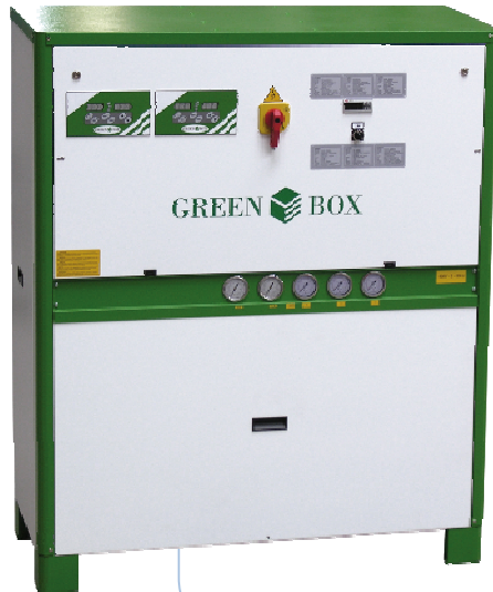
MINIBOX 1210 2/T6